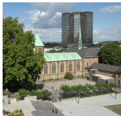
Burgplatz und Münsterkirche in Essen mit Rathaus

Rückblickend auf unsere Anforderungen an eine Vollstreckungssoftware hat avviso unsere Erwartungen erfüllt. Die Dialogschnittstelle in Form eines „Dienstes“ zum SAP ERP garantiert einen sekundenaktuellen Datenbestand und entlastet von der manuellen Forderungs- und Schuldnererfassung. Ohne zusätzlichen Schreibaufwand werden nunmehr Dokumente und Forderungsaufstellungen bei einem Terminvollzug erzeugt, Wiedervorlagen erstellt und die passenden Folgemaßnahmen optional vorgeschlagen. In avviso errechnete Zinsen, Säumniszuschläge und andere Nebenforderungen gelangen über die Schnittstelle ins Hauptrechnungswesen, eine Arbeit, die früher manuell durchgeführt werden musste. Fazit: wir sind schneller geworden und haben einen konsistenten Vollstreckungsbestand zur Geschäftspartnerbuchhaltung. Die Mitarbeiterinnen und Mitarbeiter werden von manuellen Standardtätigkeiten weitestgehend befreit. Die Liquiditätsverbesserung durch zügigeren Forderungseinzug im Vergleich zum Altsystem wird heute deutlich. Mit avviso haben wir unser Forderungsmanagement grundlegend verbessert.